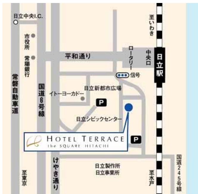
地図 B ホテル テラス ザ スクエア日立